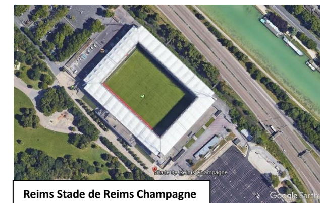
Reims Stade de Reims Champagne