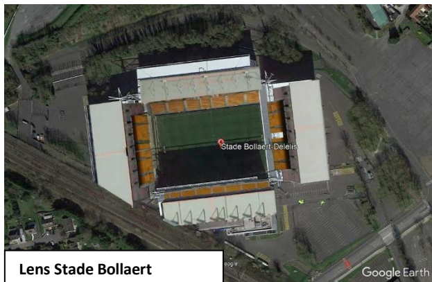
Lens Stade Bollaert