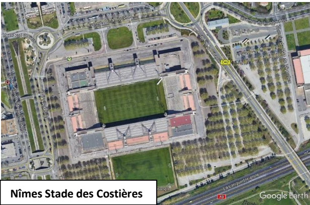
Nîmes Stade des Costières