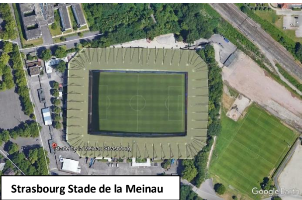
Strasbourg Stade de la Meinau