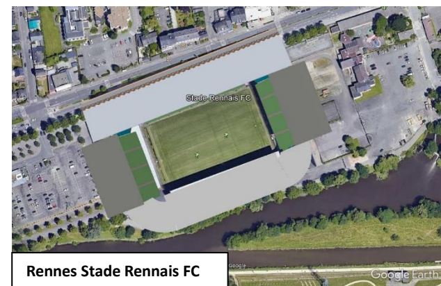
Rennes Stade Rennais FC