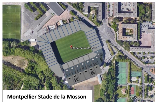
Montpellier Stade de la Mosson