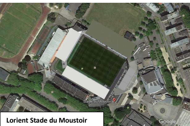
Lorient Stade du Moustoir